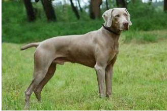
Braque de Weimar poil court